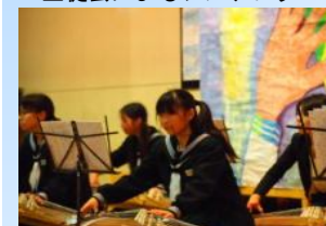
箏とフルトによるアンサンブル発表