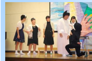
生徒会によるシンデレラ

終盤に行われたのは、生徒会企画による「演劇対決」と「有志発表」です。抱腹絶倒な脚本による演劇、格調高い箏やバンド演奏、心躍るダンス、ノリノリのミス・ミスターコンテストなど、楽しいひとときに会場が一体となって盛り上がりしました。