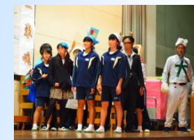
劇団小川による桃太郎