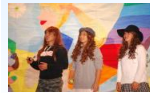
ミス・ミスターコンテスト