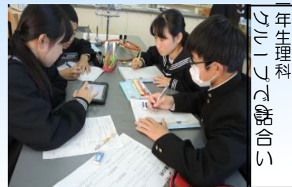
年生理科クラブで話し合い

また11月中旬には、三者面談が行われました。3年は進路を中心に、1・2年生は希望参加ではありませんでしたが、保護者の皆様と学習や生活の様子について、共通理解を図ることができました。今後もこの面談を生かし、さらなる生活向上に向け、学校と家庭が連携協力しながら取り組んでまいりたいと考えておりますので、どうぞよろしく願います。