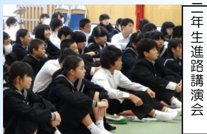
二年生進路講演会

大きな行事が続いた2学期も、本日をもって終了しました。この2学期、行事や新人体育大会、東輝祭、各種展覧会やコンクール等で、本校の生徒は、率先して取り組み、輝かしい活躍を見せてくれました。そして一人一人が、本校のスローガンある『keep the charenge ~未来への挑戦~』を意識し、目指す生徒像①進んで学習する生徒、②思いやりのある生徒、③心身ともにたくましい生徒の実現に向け、一生懸命に取り組んできました。